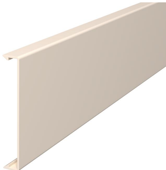
Oberteil zum Verschließen der Kanäle.