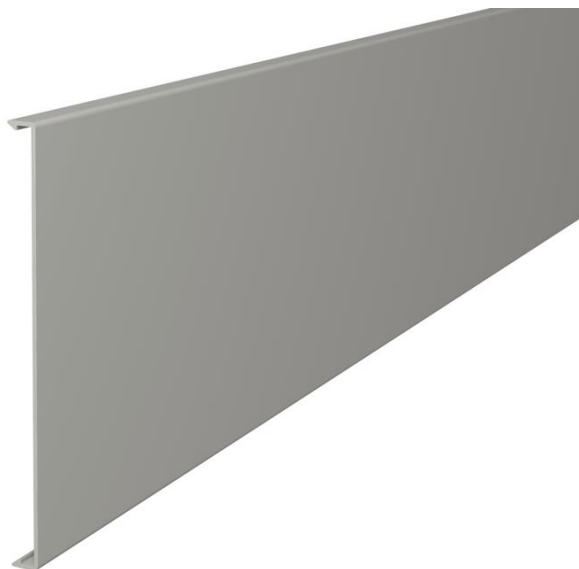
Oberteil zum Verschließen der Kanäle.