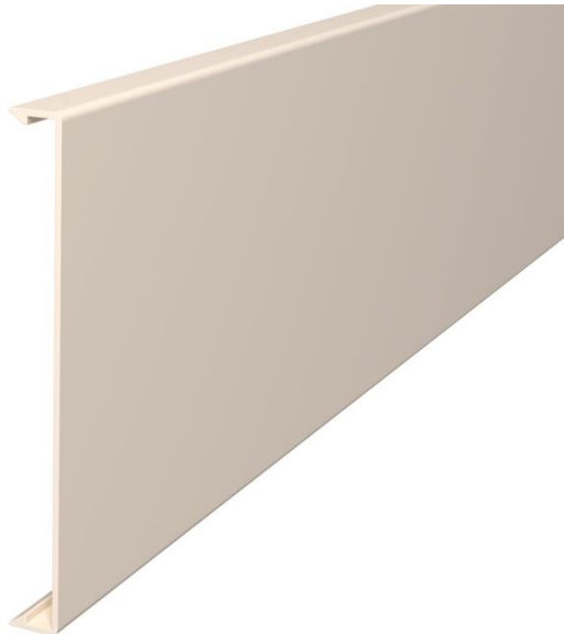
Oberteil zum Verschließen der Kanäle.