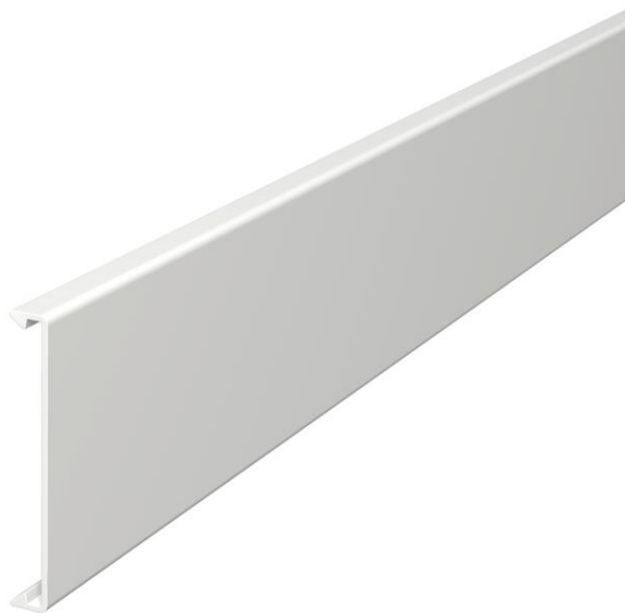
Oberteil zum Verschließen der Kanäle.