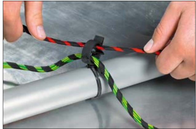
HarnessClips CBTO, 90° drehbar.