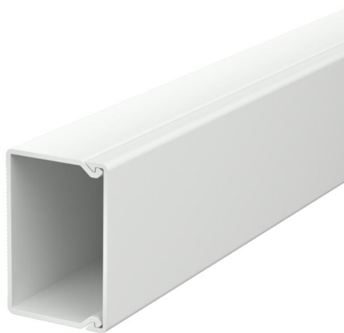
Kanaloberteil und -unterteil mit Bodenlochung.