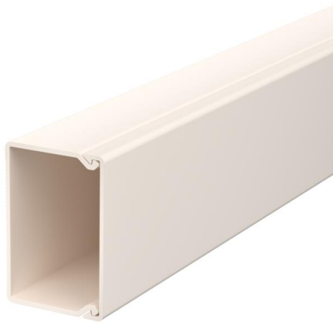
Kanaloberteil und -unterteil mit Bodenlochung.