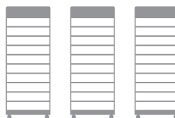
3 x HVB 29.6