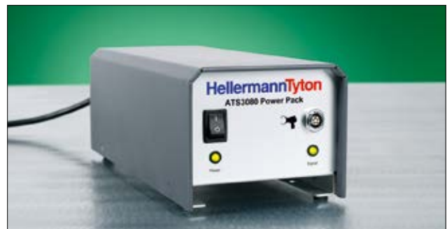
Schaltnetzgerät für ATS3080.