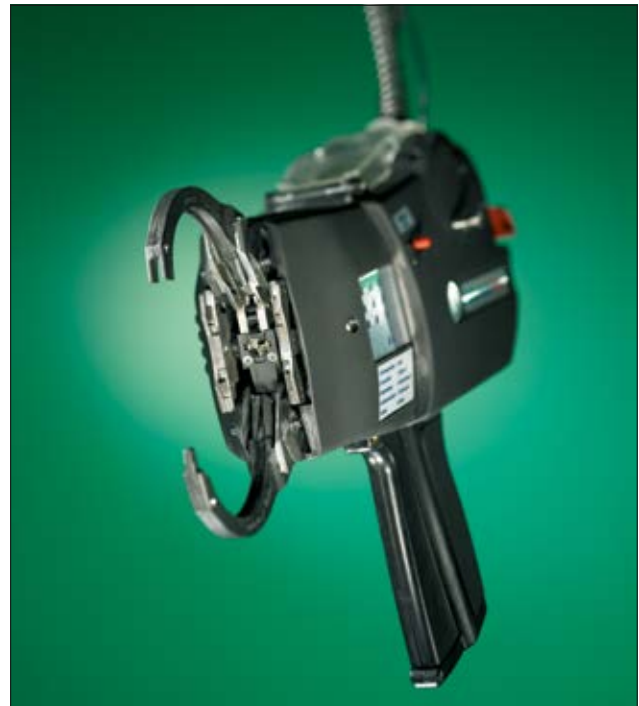
Autotool System 3080.