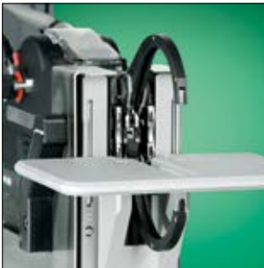
Optional: Montagevorrichtung mit Tischplatte.