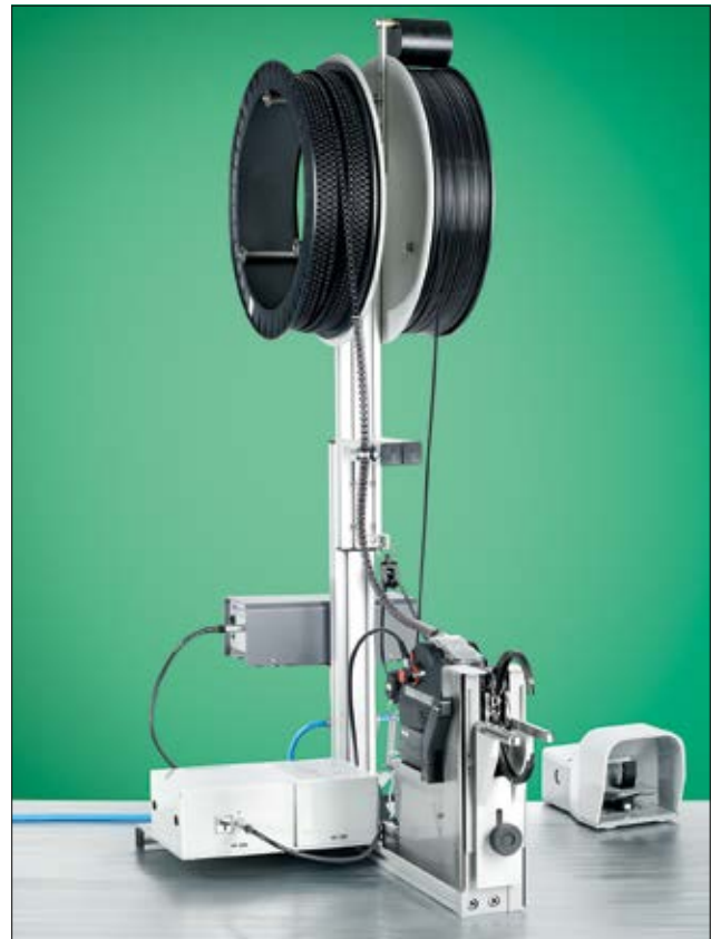
Montagevorrichtung mit ATS3080, Schaltnetzgerät, Fußschalter und Verbrauchsmaterial.