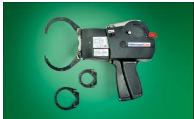
Autotool System 3080 mit drei Zangengrößen - zum Optimieren des Abbindezyklusses für die unterschiedlichen Bündeldurchmesser.