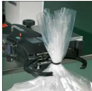
Anwendungsbeispiel: Verschließen von Beuteln in der horizontalen Montagevorrichtung.