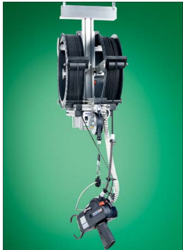
Hängevorrichtung mit ATS3080 und Verbrauchsmaterial.