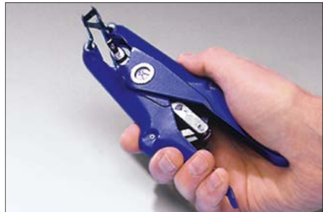
Einfache und sichere Montage von Tüllen und Schläuchen durch Dreidornzangen.