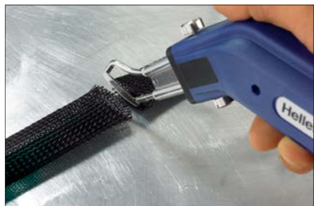
Das Ausfransen beim Schneiden eines Geflechtsschlauchs lässt sich mit dem HSGO vermeiden.

Ein Ersatzmesser ist mit der Artikelnummer 170-99002 separat erhältlich.