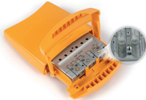
▲ ESWM31 (4041)