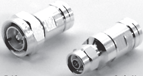
Serie 7-16 Series 7-16

für Kabel / for cable: G23 5092 1/2"-Hiflex Eupen FSJ4-50B Andrew HFSC 12D LS Cable HPL 50-1/2SF Acome RFF 1/2"-50 Draka SCF 12-50 J RFS Flexline 1/2" S Leoni Sucofeed_1/2_HF Huber+Suhner