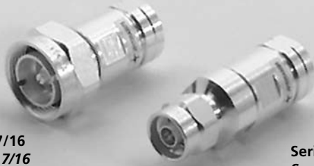
Serie 7/16 Series 7/16

für Kabel / for cable: G23 5092 1/2"-Hiflex Eupen FSJ4-50B Andrew HFSC 12D LG Cable HPL 50-1/2SF Acome RFF 1/2"-50 Draka SCF 12-50 J RFS Flexline 1/2" S Leoni