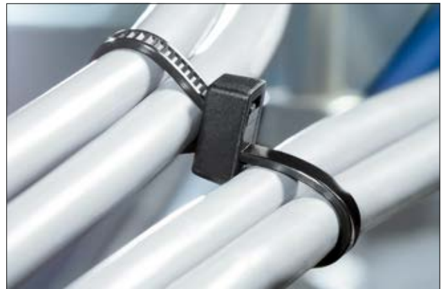
Zur Parallelbündelung mehrerer Leitungen eignen sich Kabelbinder der DH-Serie.