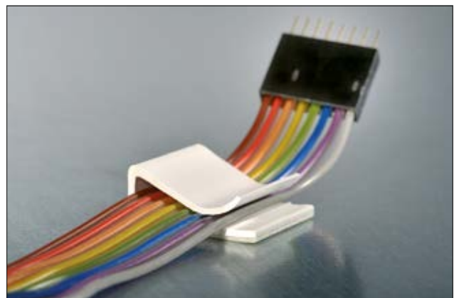
Befestigungssockel 130100 für Flachbandkabel.