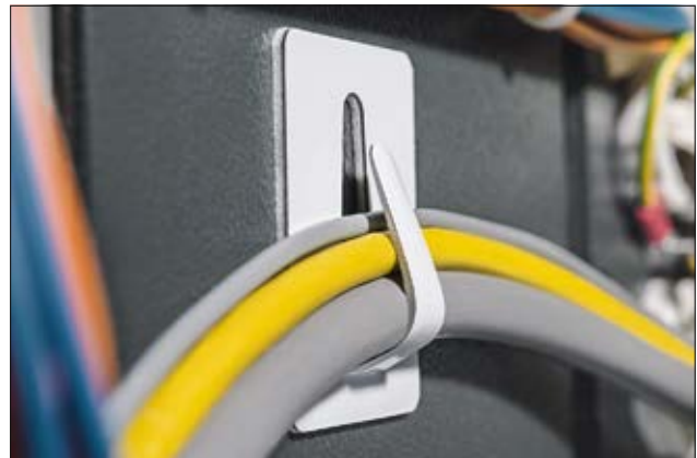
Die biegsame Metallnase ermöglicht die Befestigung von verschiedenen Kabeldurchmessern.