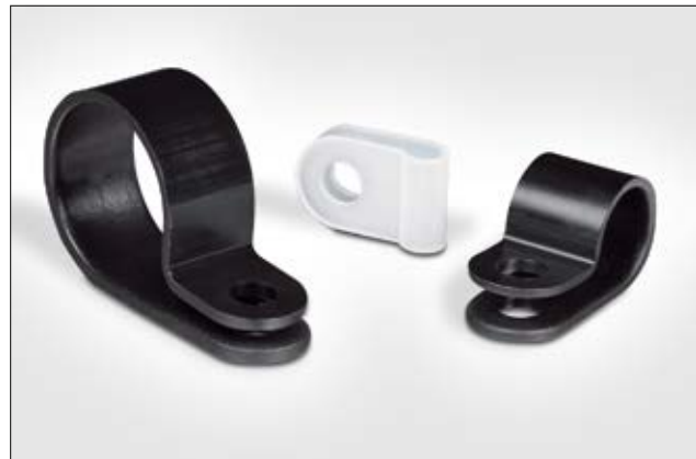
Die Kunststoffschellen der HP-Serie sind in verschiedenen Größen erhältlich.