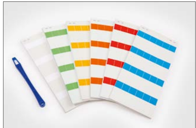
HELASIGN Kabellaminieretiketten im Taschenbuch – robust und aufmerksamkeitsstark.