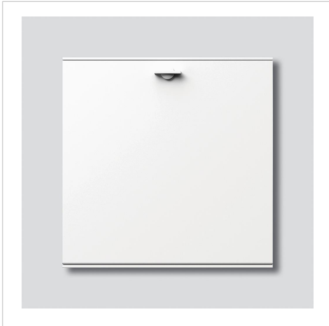
Ablagefach-Modul AFM 611-4/4-0 W