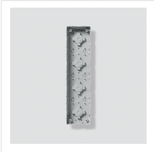
Unterputzgehäuse GU 611-4/1-0