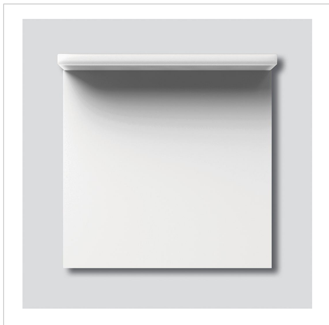
LED-Flächenleuchte LEDF 600-3/3-0 W 200037343-00