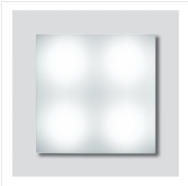
LED-Lichtmodul LEDM 600-0 200036851-00