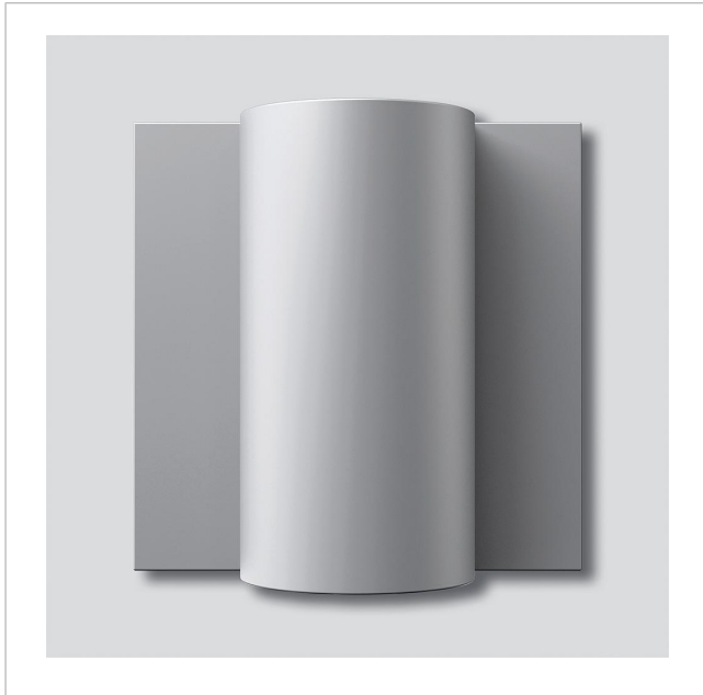
LED-Spot LEDS 600-0 SM 200036617-00