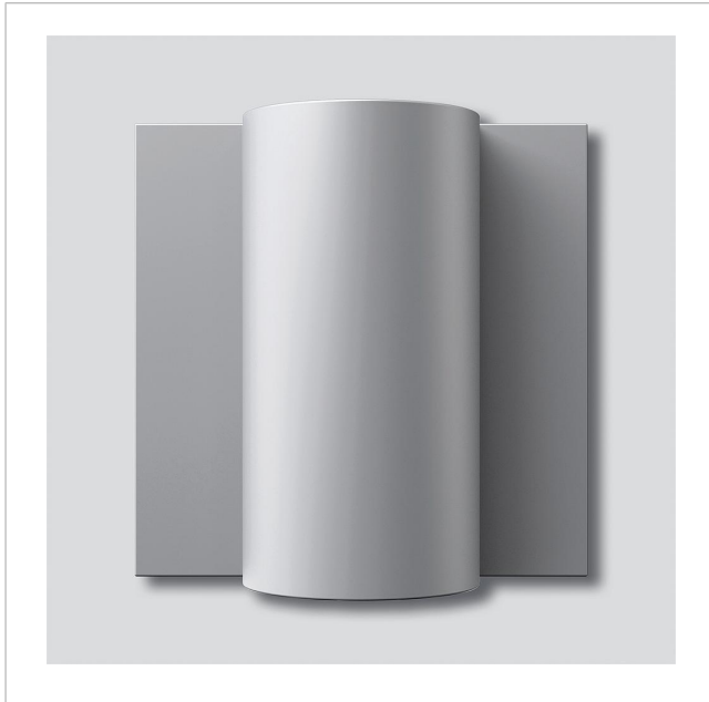
LED-Spot LEDS 600-0 SM 200036617-00