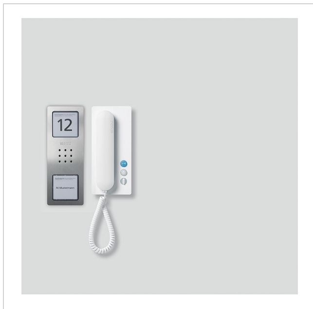
Audio-Set Siedle Compact SET CA 812-1 E/W 210008738-00