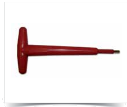
Abb.: Isoliertes Werkzeug ZK4R