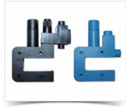
Abb.: ZK4S und ZK 4B