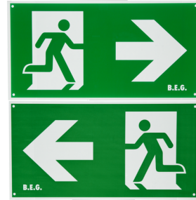
Piktogramm zweiseitig/rechts-links Art.No: 8860

Abmessungen: 47 x 19 x 10 mm Schutzart/-klasse: IP20 Umgebungstemperatur: -20 °C bis +40 °C