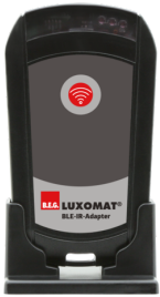
BLE-IR-Adapter Art.No: 93067

Abmessungen: 40 x 55 x 103 mm Farbe: schwarz Frequenz: 2.4 GHz ISM-Band, GFSK 0.2 dBm + 5.3 dBi = 5.5 dBm