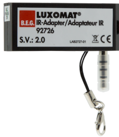
IR-Adapter für Smartphones Art.No: 92726

Abmessungen: 40 x 55 x 103 mm Farbe: schwarz Frequenz: 2.4 GHz ISM-Band, GFSK 0.2 dBm + 5.3 dBi = 5.5 dBm