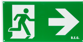
Piktogramm DT32-LED Pfeil nach rechts Art.No: 8858

Abmessungen: 170 x 330 x 1 mm Gehäuse: Kunststoff Farbe: grün