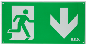
Piktogramm DT32-LED Pfeil nach unten Art.No: 8785

Abmessungen: 170 x 330 x 1 mm Gehäuse: Kunststoff Farbe: grün