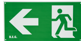
Piktogramm DT32-LED Pfeil nach links Art.No: 8859

Abmessungen: 170 x 330 x 1 mm Gehäuse: Kunststoff Farbe: grün