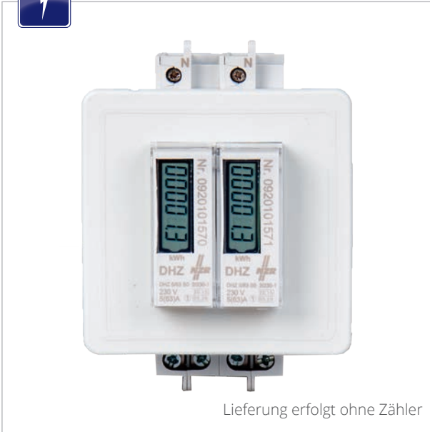
Lieferung erfolgt ohne Zähler