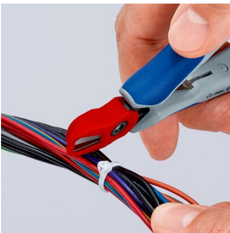
Einfach aufstecken: Der Abschnittfänger ist leicht angebracht und hält zuverlässig am Zangenkopf

Technische Änderungen und Irrtümer vorbehalten