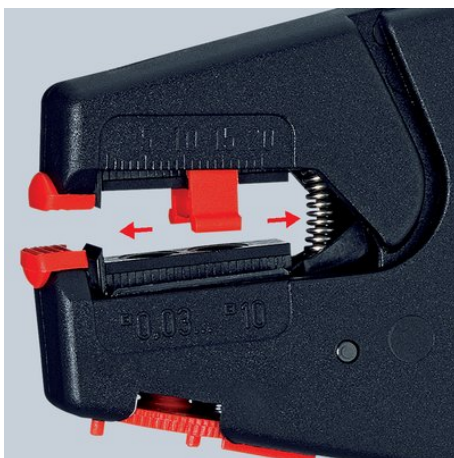
12 40 200: Einstellbarer Längenanschlag

Technische Änderungen und Irrtümer vorbehalten