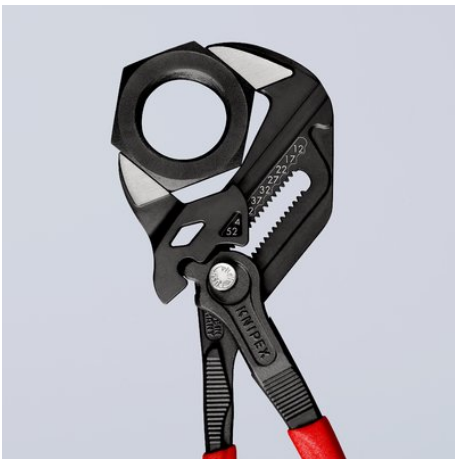
Schlüsselweite metrisch (Vorderseite) und zöllig (Rückseite) am Zangenkopf eingelasert