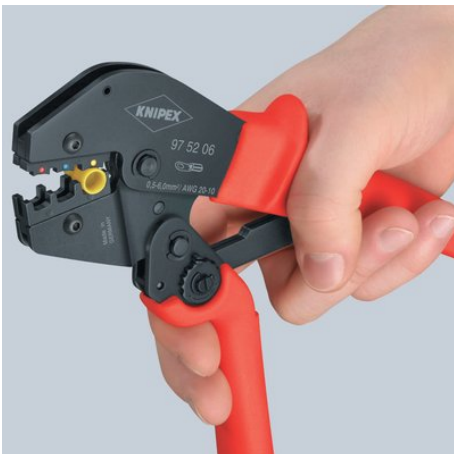
Erster Schritt: Heranholen des Schenkels mit zwei Fingern, bis beide Backen auf dem zu vercrimpenden Verbinder aufliegen