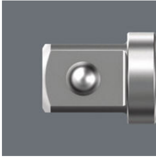
Mit Kugel; für handbetätigte Steckschlüsseinsätze