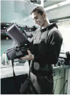
Wera 2go 1 - Der Dranpacker