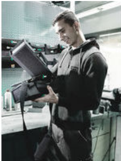
Wera 2go 1 – Der Dranpacker