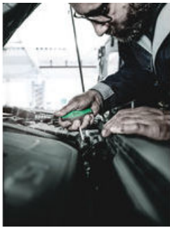
Schraubendreher mit Quergriff