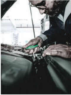
Schraubendreher mit Quergriff