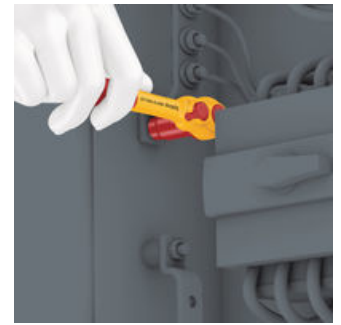
Durch ihre extrem schlanke Bauform ermöglicht die Zyklop VDE-Knarre einfaches Arbeiten auch in sehr engen Bauräumen.