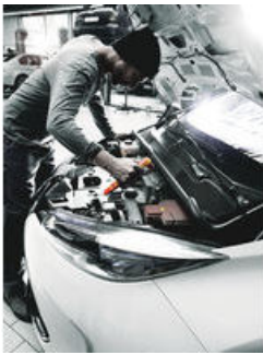
Zyklop Knarre und Zubehör für Elektriker