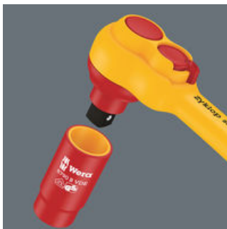
Die Kugelarretierung sorgt für sicheren Sitz der Nüsse und des Zubehörs und damit auch für verlässliche Sicherheit während des Verschraubens.