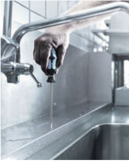
Edelstahl mit Edelstahl verschrauben!