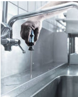
Edelstahl mit Edelstahl verschrauben!