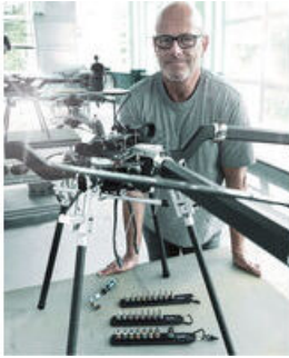
Die Wera Belts