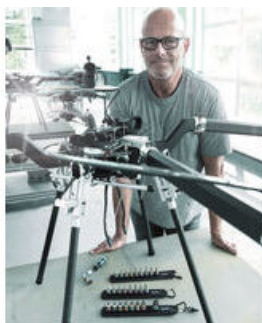
Die Wera Belts