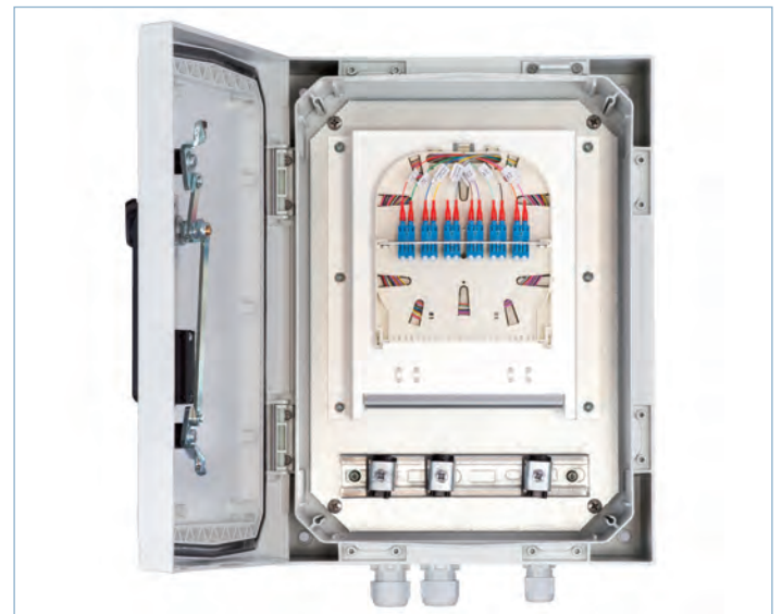
RDB bestückt mit 6 LC Duplex Kupplungen und 12 OS2 Pigtails

Für die Befestigung an Signalmasten ist eine Adapterplatte verfügbar, die an den Verteiler optional angebracht werden kann.