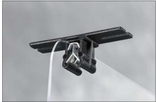
Kabel und Leitungen lassen sich mit Hilfe eines Kabelbinders oder Klebebandes an den Stegen des Befestigungselementes befestigen.