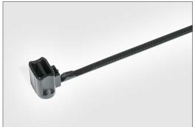
Der Befestigungsbinder T50SOSSB5-High-E-C-CC für den sicheren Halt auf Schweiß- oder Gewindebolzen.