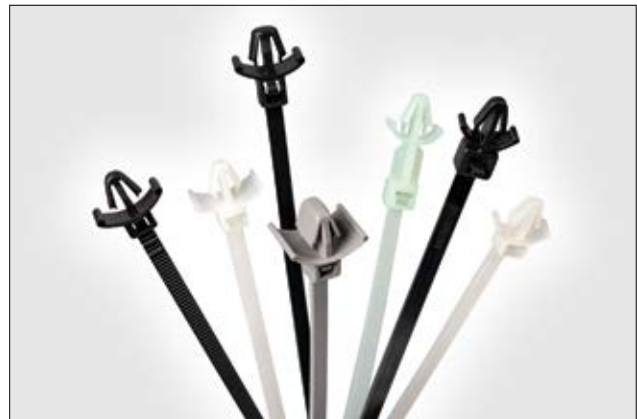
Befestigungsbinder mit Spreizanker gibt es in verschiedenen Variationen. Sie lassen sich fühl- und hörbar verarbeiten.