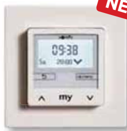
Chronis Smoove IB+ Pure White inkl. Smoove Rahmen Pure