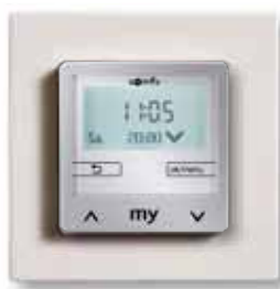
Chronis Smoove IB+ Pure inkl. Smoove Rahmen Pure