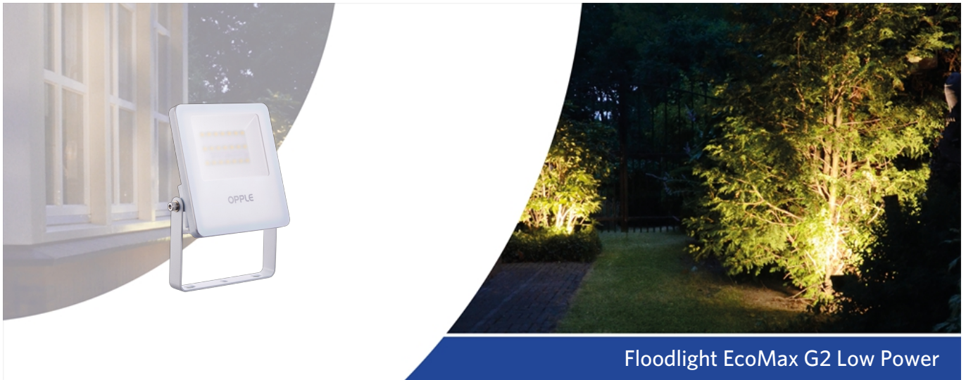
Floodlight EcoMax G2 Low Power