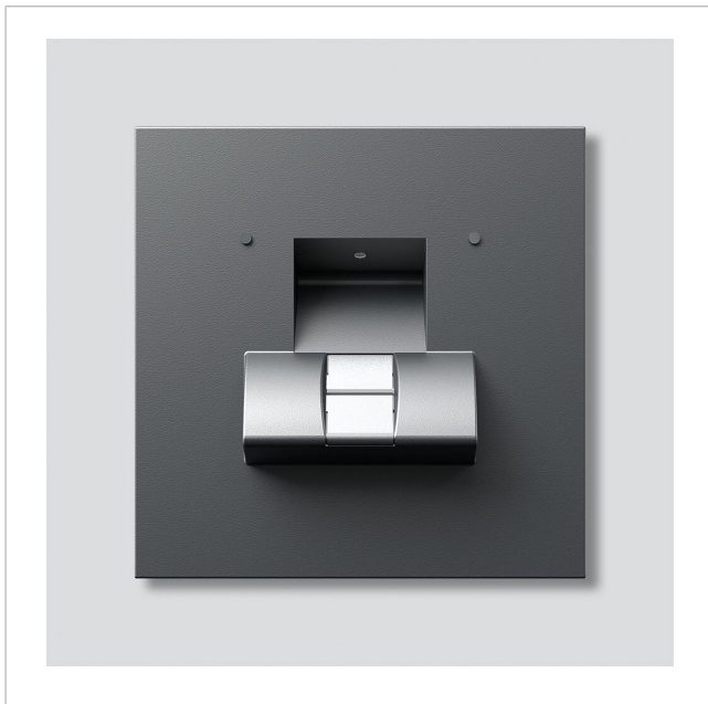
Fingerprint-Modul FPM 600-0 DG 210009609-00