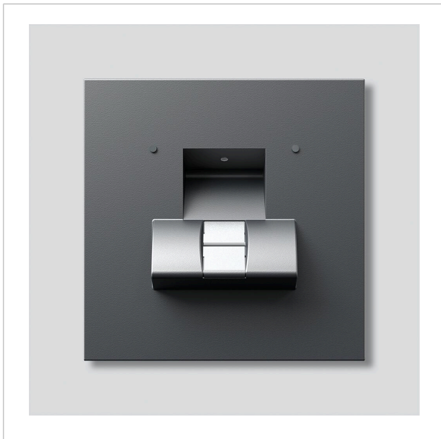
Fingerprint-Modul FPM 600-0 DG 210009609-00