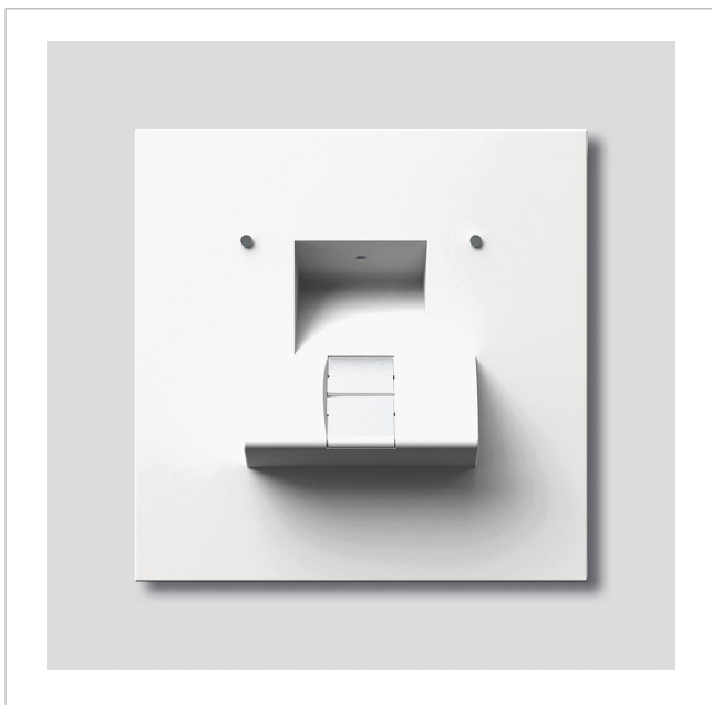
Fingerprint-Modul FPM 600-0 W 210009607-00