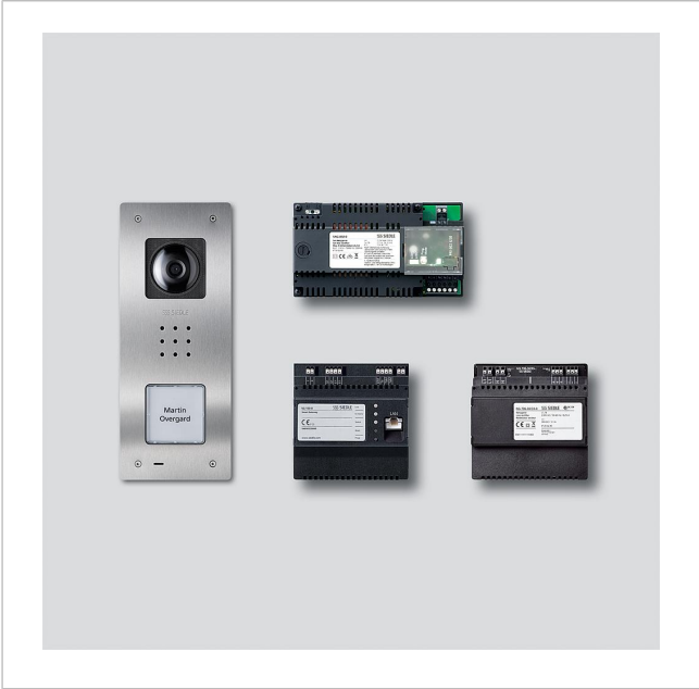
Starter-Set Smart Gateway für Unterputz SET CVUSG 850-1-01 210009825-01

Starter-Set Smart Gateway für Unterputz in Bus-Technik mit den Funktionen Rufen, Sprechen, Sehen und Türöffnen. Anzahl Ruftasten: 1