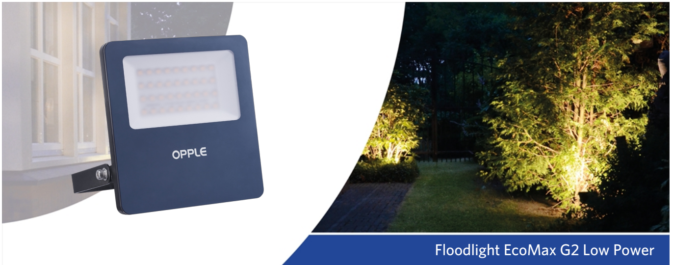
Floodlight EcoMax G2 Low Power