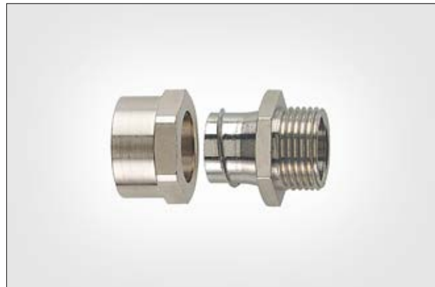
HelaGuard SCSB-FM mit starrem Außengewinde.