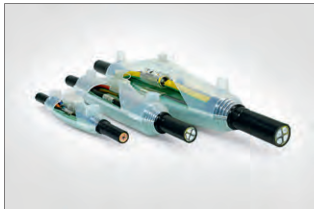
Verbindungsgarnituren i-Line SF (sicheres Füllen).